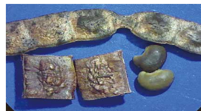
写真 3. クサネムの莢と種子