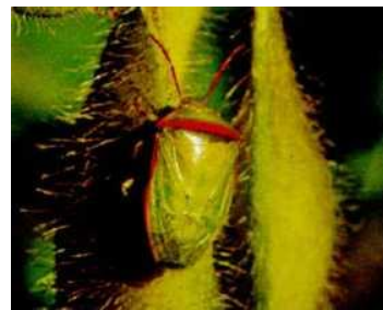
写真5. イチモンジカメムシ