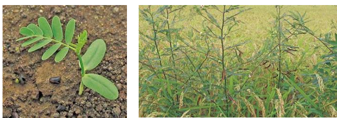
写真 2. ほ場でのクサネムの様子

9 月はクサネム (写真 2) の開花・結実の時期です。クサネムの子実 (写真 3) は黒く、米と似た重さ・大きさでグレーダーでの選別も難しく、等級低下の原因となります。稲と一緒に刈り取ると、機械で除去するのは難しくなるので、収穫前か収穫時に子実を落とさないよう圃場から除去しましょう。