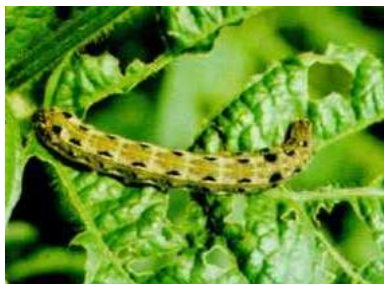
写真4. ハスモンヨトウ

この時期の大豆は子実の肥大期にあたり、ハスモンヨトウ(写真4)・カメムシ類(写真5)などによる被害粒が多発することが懸念されますので、株元・葉の裏までしっかり薬剤がかかるように防除を実施します。また、周辺作物に薬剤が飛散しないように注意して防除を行いましょ。